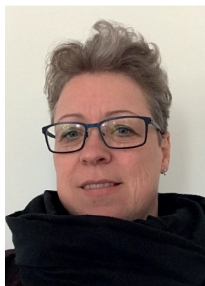
◀ Formand for Fagligt Selskab for Sundhedsplejersker "Hvordan kan vi undgå at slukke børnenes drivkraft?"